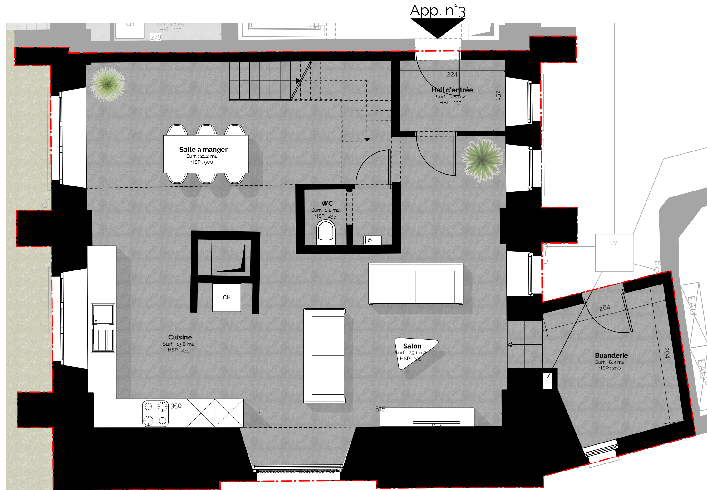
App.03 - Ro