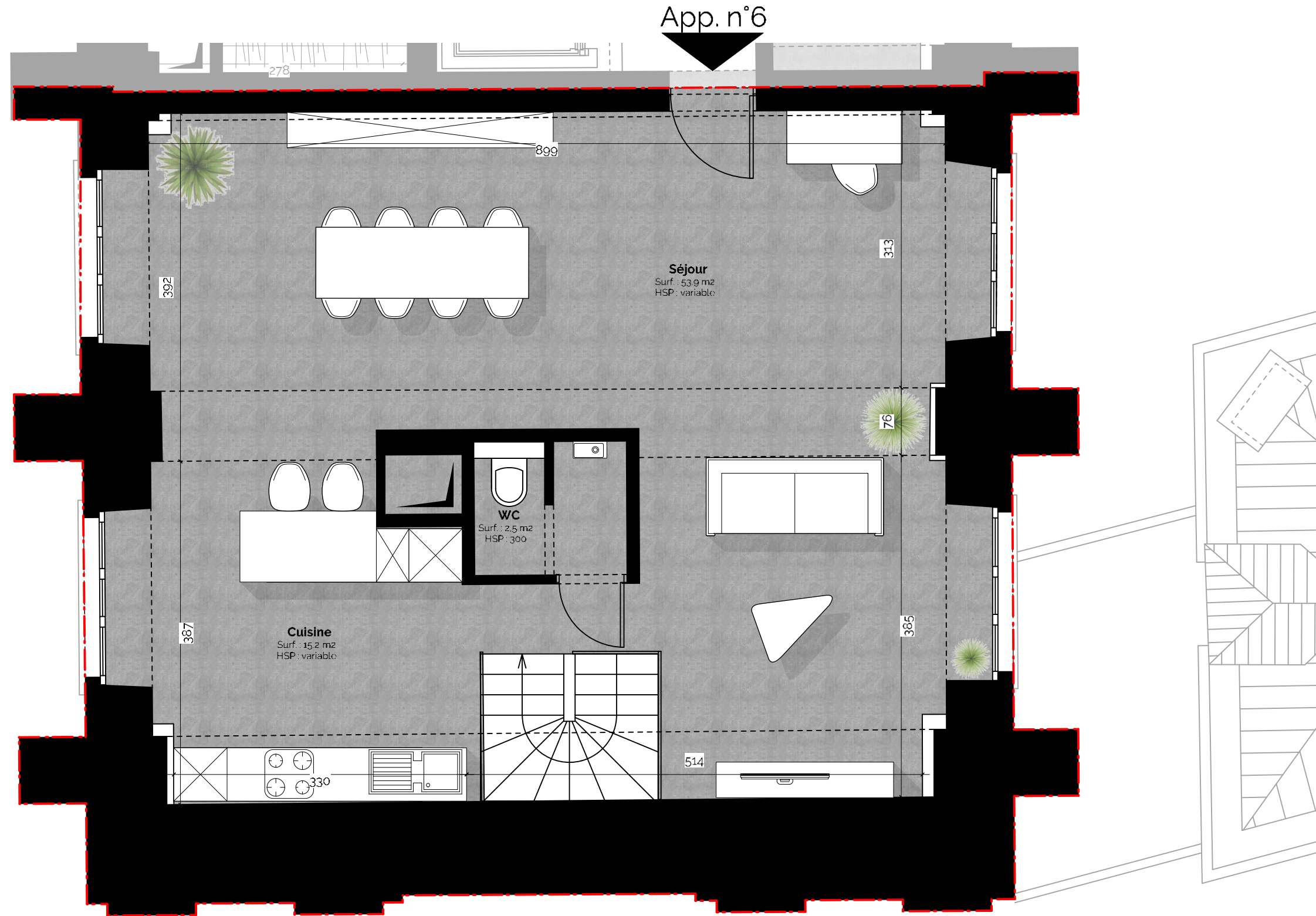
App.06 - R+3