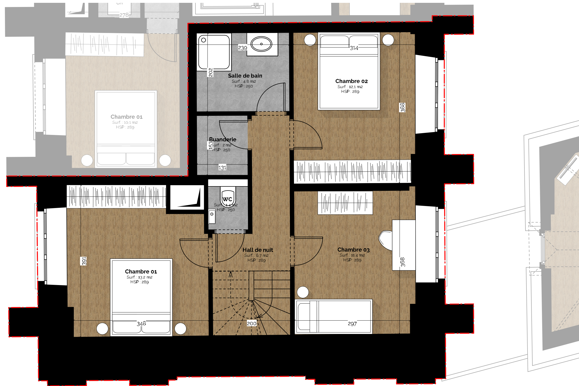
App.06 - R+2